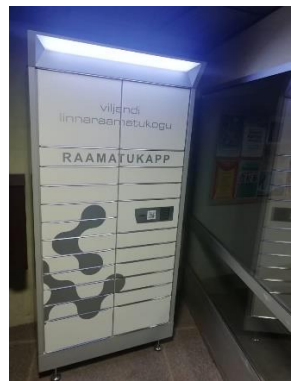
Sündmuste programm kõigile huvilistele ja kontaktivaba teenindus